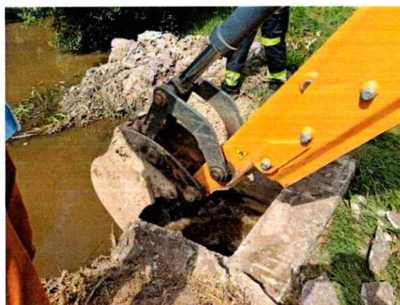
Wylawianie ryb i spuszczenie wody ze stawu